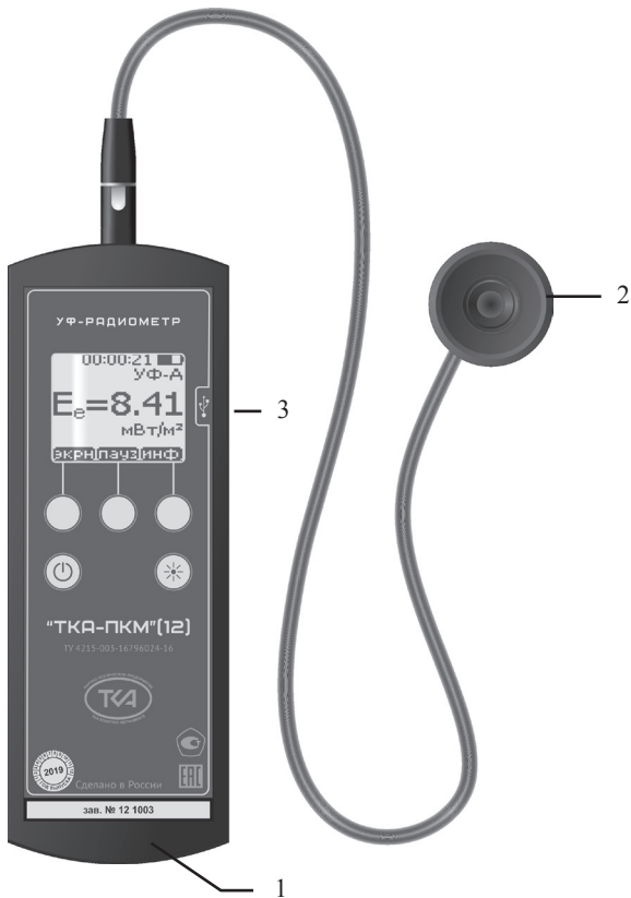
Рис.1 – Внешний вид прибора “ТКА-ПКМ”(12)